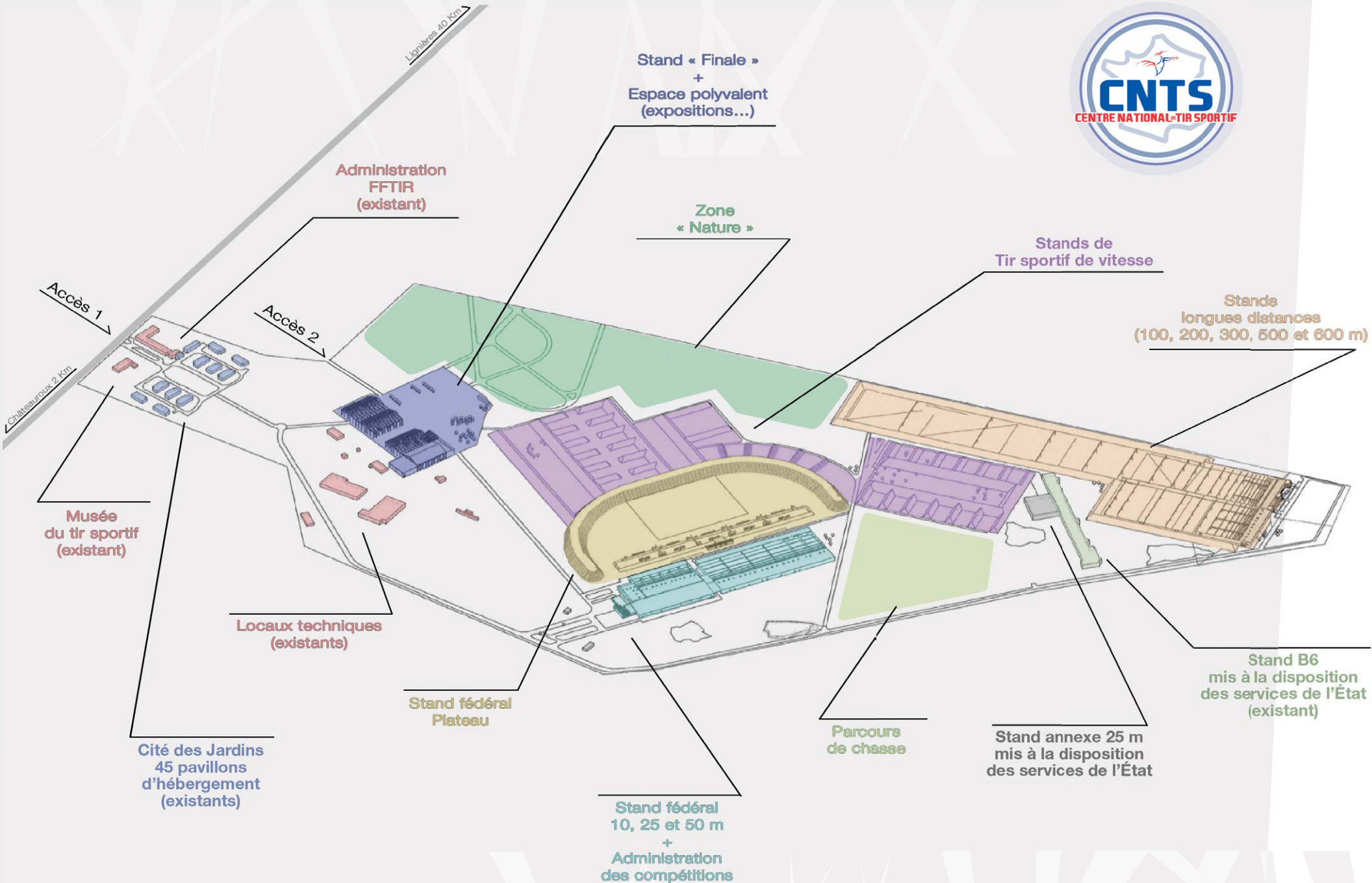
Schéma général d'implantation du CNTS