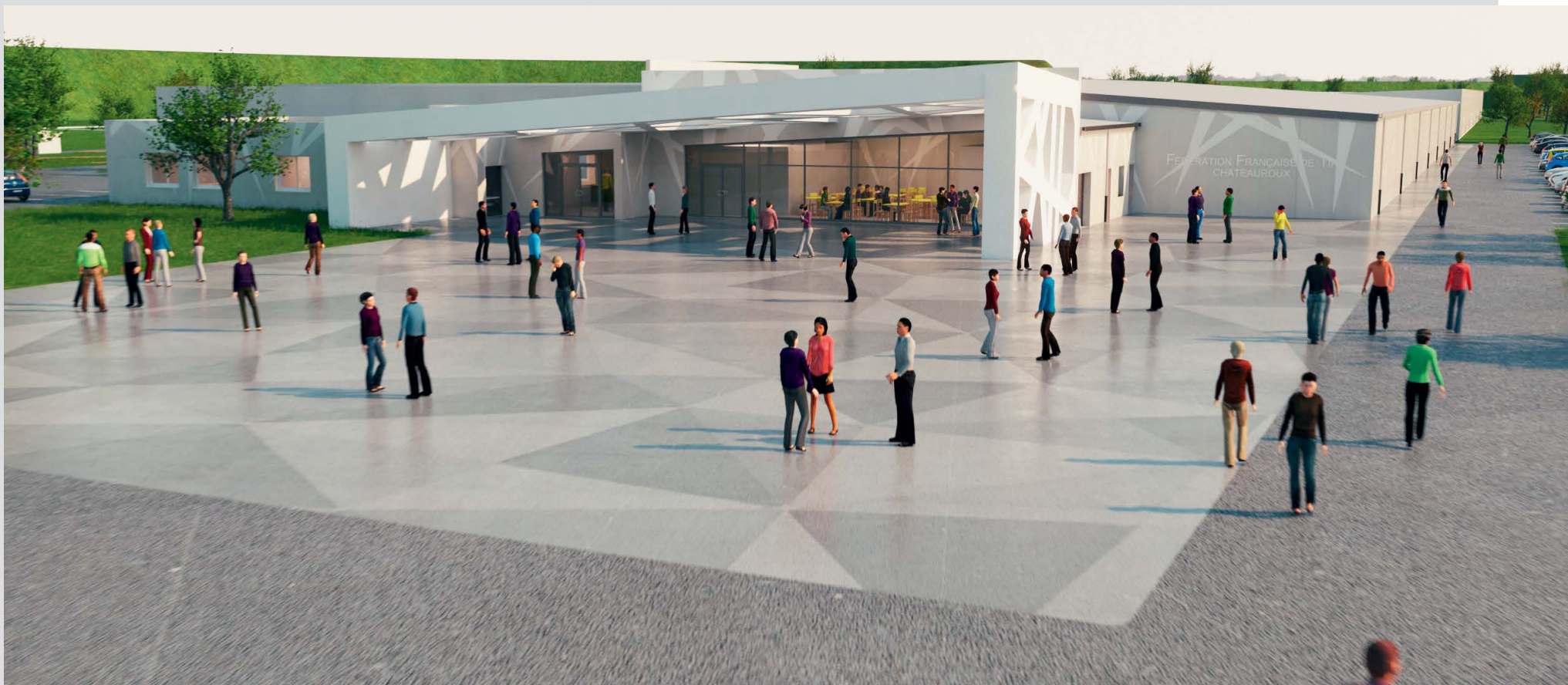
Parvis devant l'entrée du stand fédéral 10, 25 et 50 m