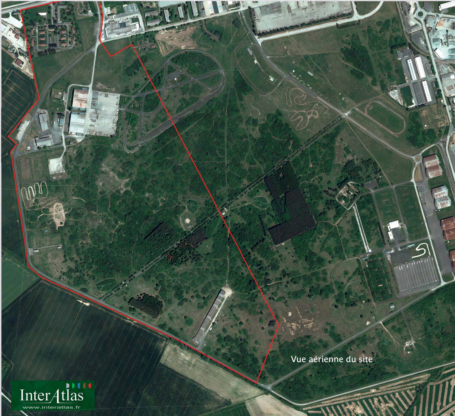
Vue aérienne du site