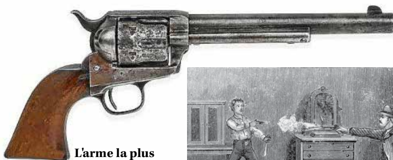
L'arme la plus chère de tous les temps : le Colt Single Action Army du sheriff Pat Garrett.