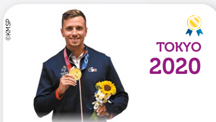
TOKYO 2020 Jean QUIQUAMPOIX / Médaille d'Or Vitesse olympique