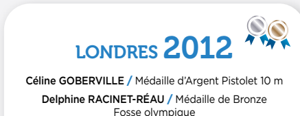
LONDRES 2012 Céline GOBERVILLE / Médaille d'Argent Pistolet 10 m Delphine RACINET-RÉAU / Médaille de Bronze Fosse olympique