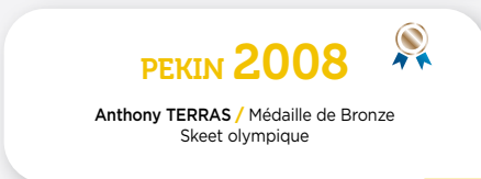
PEKIN 2008 Anthony TERRAS / Médaille de Bronze Skeet olympique